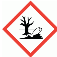
Pictograma NCh 1411/4